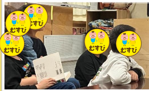
SST、製作活動、ゲームなどグループに分かれて取り組んでいます