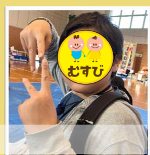
こども食堂のイベントに参加♪ミニゲームや