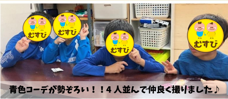
青色コーデが勢ぞろい！！4人並んで仲良く撮りました♪