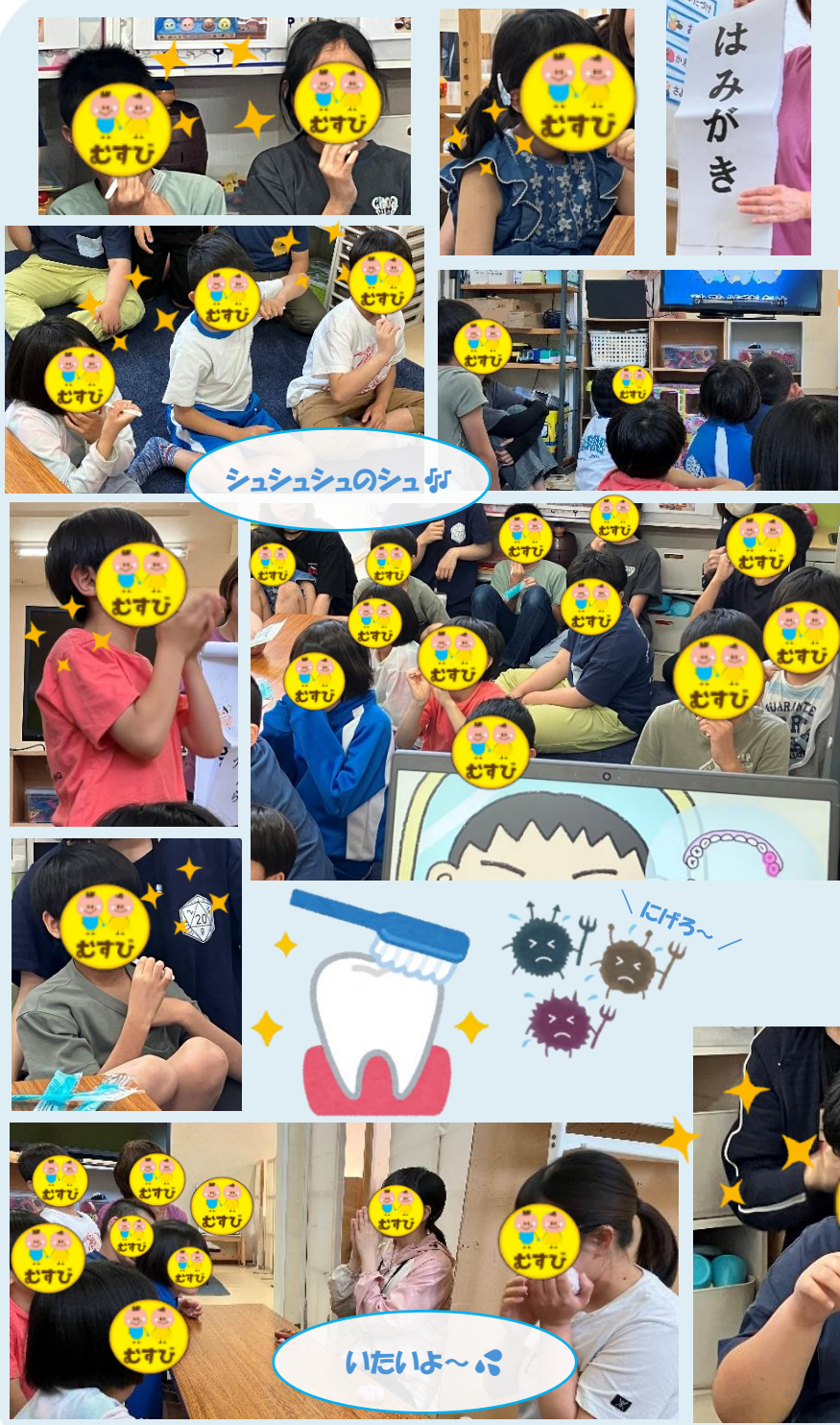
シュシュシュのシュが